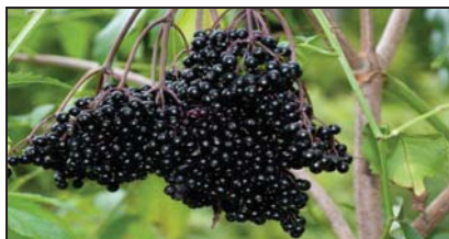
Фиг. 1. Плод черен бъз ( Sambucus nigra )

Лист от черен бъз – Folium Sambuci nigri .