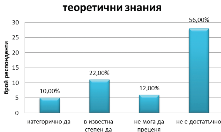
Фиг. 1. Самооценка на студентите относно теоретичните знания за грижите при коремни травми

Значителна част от анкетираниите студенти – 56,00%, посочват, че теоретичните знания, които имат по отношение на грижите за пациенти с коремни травми, не са достатъчни. Отговор “категорично да” е посочен от 10,00% от анкетираниите. Студентите, които дават отговор “в известна степен да” са едва 22,00%, а тези, които отговарят “не мога да преценя”, са 12,00%. Тези резултати определено сочат необходимостта от теоретично обучение по тази тема, така че студентите да придобият необходимата теоретична подготовка, за да се справят с проблемите на пациентите с коремна травма.