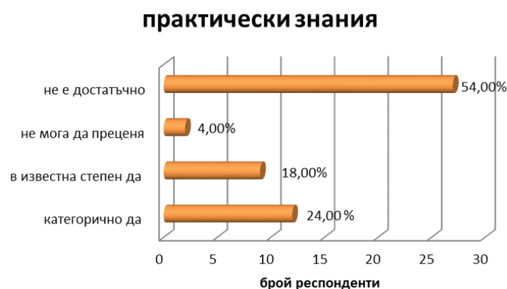
Фиг. 2. Самооценка на студентите относно практическата подготовка