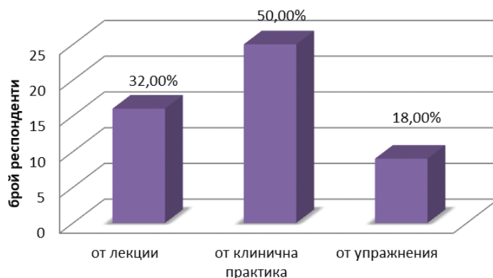
Фиг. 3. Източници на знания

По отношение на алгоритъма на поведение при коремни травми 78% от студентите не се чувстват достатъчно подготвени. Само 6% са уверени, че са способни да се справят, а 16% смятат, че са изцяло неподготвени.